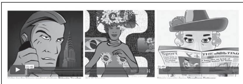
Rysunek P.2. Filmy promocyjne wyprodukowane przez Bitfilm